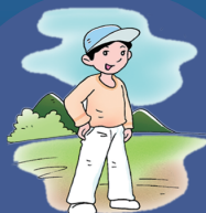
户外穿浅色长袖衣裤