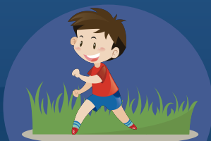
避免在户外阴暗的 蚊虫孳生处逗留